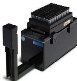
オプション 1Dリーダー取付時 写真はイメージ部のみ